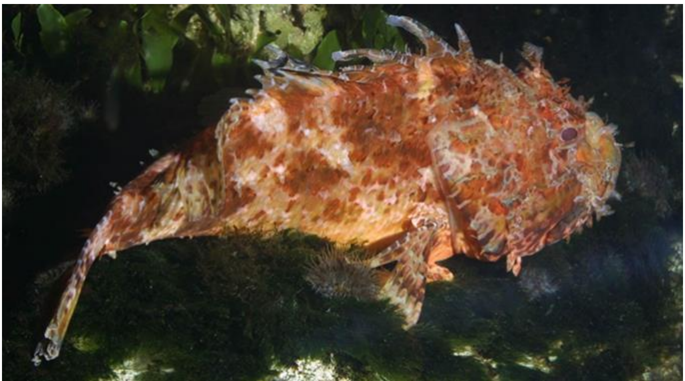
4. Espace Méditerranéen - RASCASSE