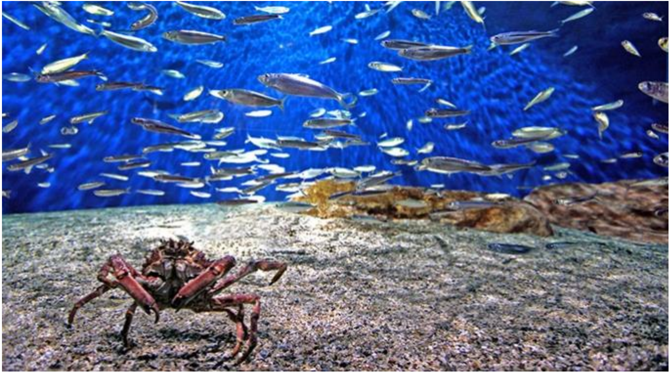
1. Espace Atlantique - SARDINE