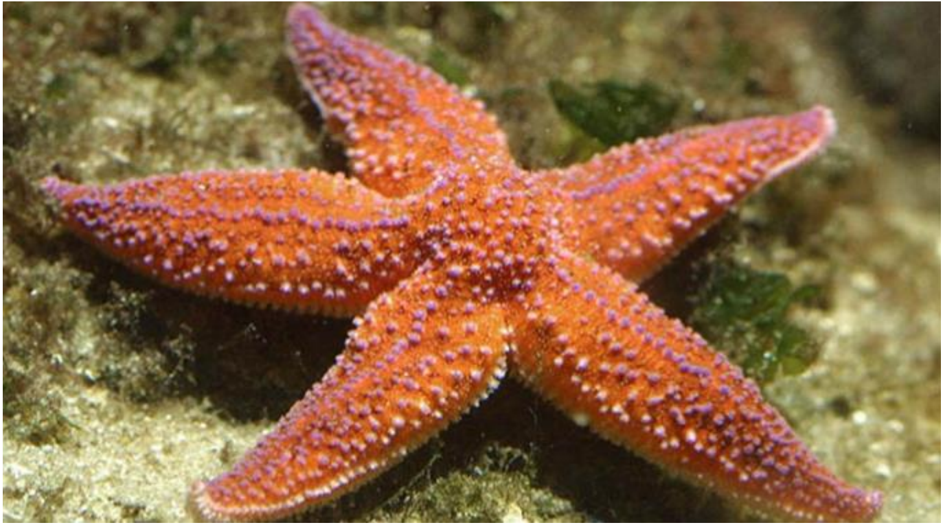
3. Espace Atlantique - ETOILE DE MER COMMUNE