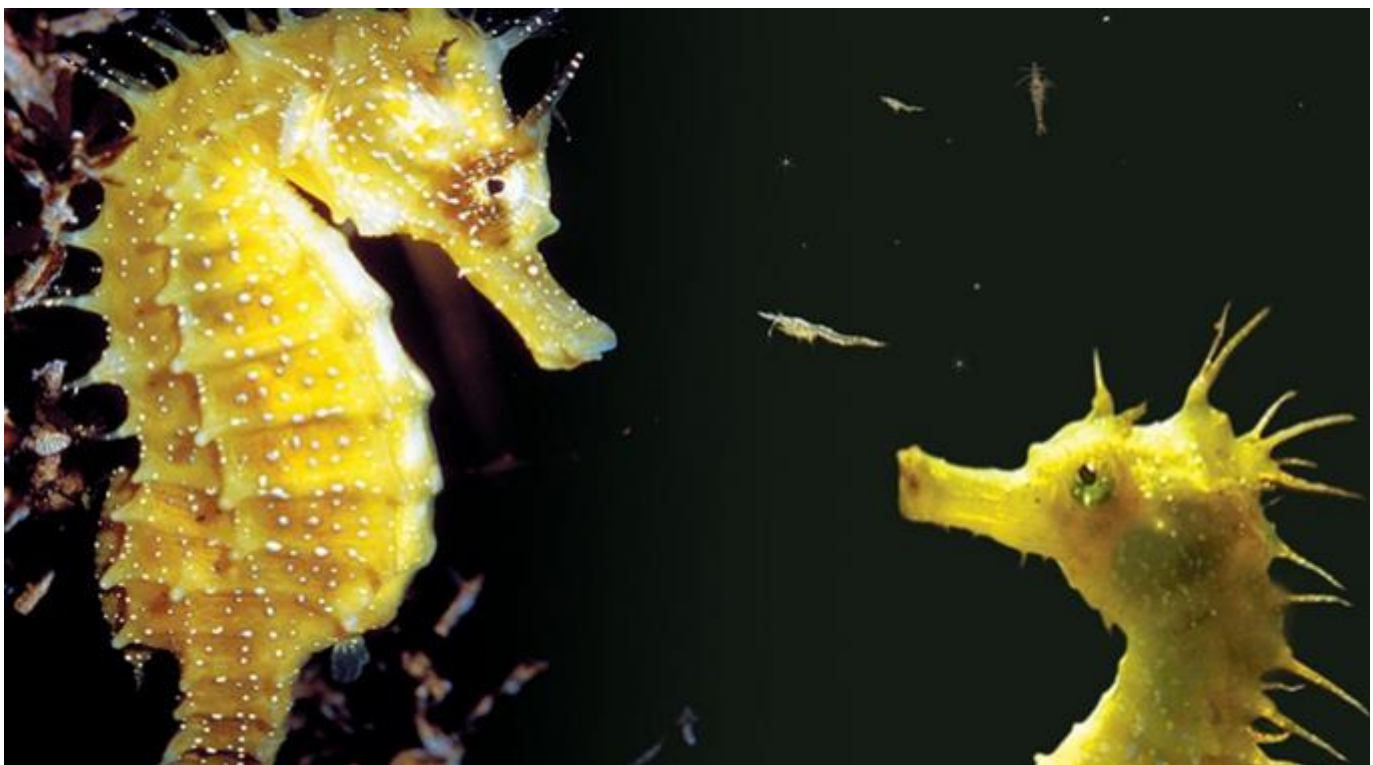
2. Espace Atlantique - HYPOCAMPE MOUCHETEE